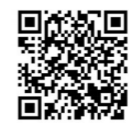
扫码看视频 直击放鱼活动现场